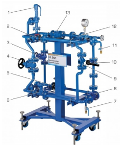
1 soupape de sécurité, 2 robinet à tournant sphérique, 3 soupape d'arrêt, 4 robinet-vanne à coin, 5 robinet à piston, 6 soupape à diaphragme, 7 robinet à tournant sphérique/raccord d'eau, 8 soupape de retenue, 9 purgeur de vapeur, 10 clapet d'arrêt, 11 purge d'air, 12 collecteur d'impuretés, 13 voyant