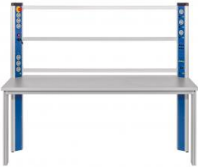
Table équipée d'une console d'alimentation, cadre de montage, cadre mobile pour le groupe frigo

Ce poste de travail/laboratoire permet le montage d'un banc d'essai complet en combinaison avec l'unité de base ET 910 et les kits de complément ET 910.10 et ET 910.11 ainsi que le kit d'accessoires ET 910.12.