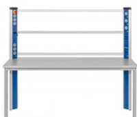
Table équipée d'une console d'alimentation, cadre de montage, cadre mobile pour le groupe frigo

Ce poste de travail/laboratoire permet le montage d'un banc d'essai complet en combinaison avec l'unité de base ET 910 et les kits de complément ET 910.10 et ET 910.11 ainsi que le kit d'accessoires ET 910.12.